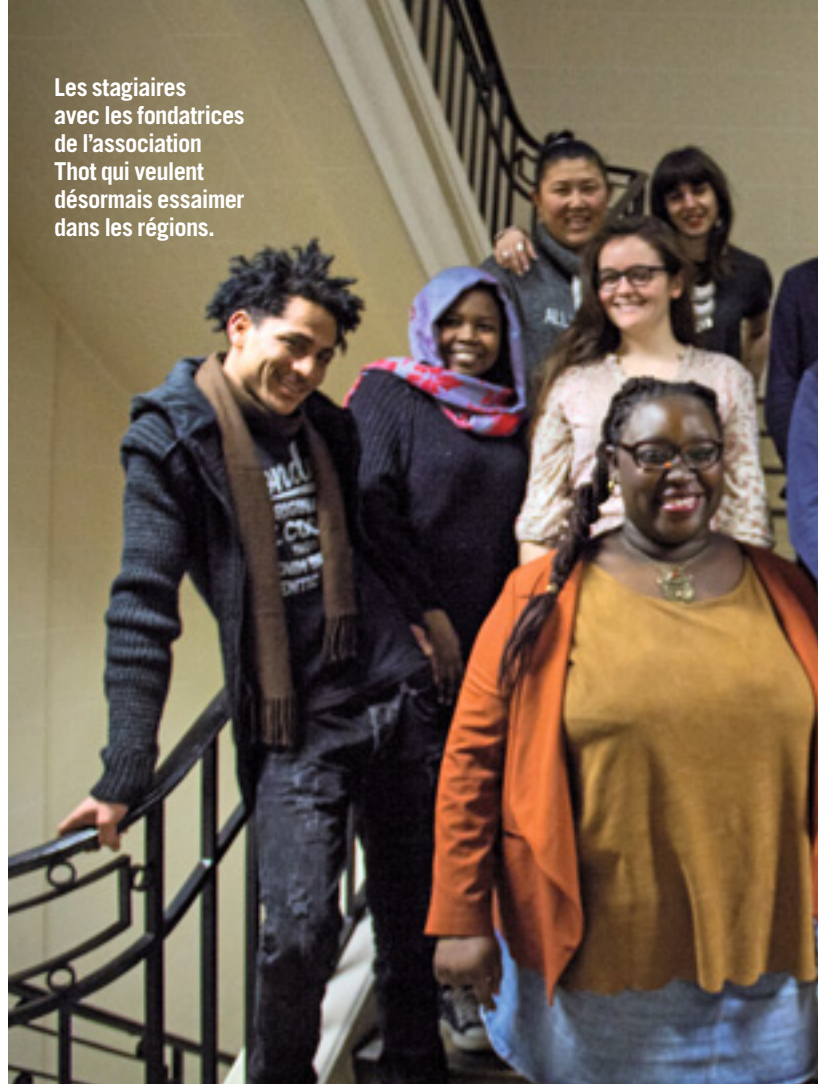
Les stagiaires avec les fondatrices de l'association Thot qui veulent désormais essaimer dans les régions.