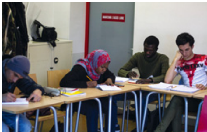
Comme dans un lycée ordinaire, toute absence doit être justifiée.